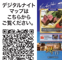
デジタルナイトマップはこちらをご覧ください。