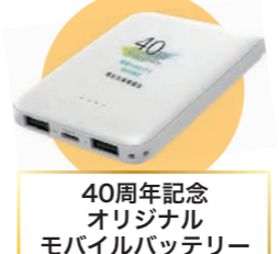
40周年記念 オリジナル モバイルバッテリー

当日は創立40周年を記念して、組合オリジナルのモバイルバッテリーを配布しました。また、デジタルナイトマップPR用のオリジナルティッシュの配布、動画による店舗紹介(デジタルナイトマップ)も記念事業として令和6年度も継続し、組合員店の広報事業を強化してまいります。